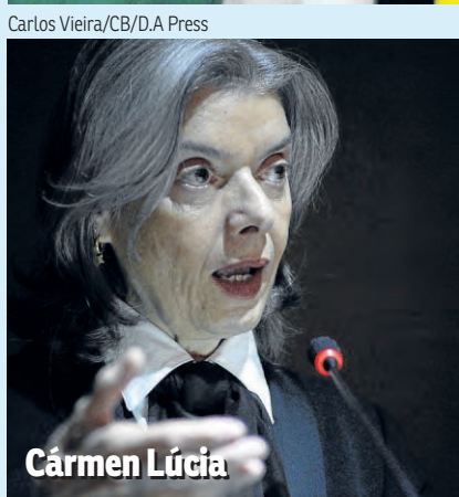
Carlos Vieira/CB/D.A Press